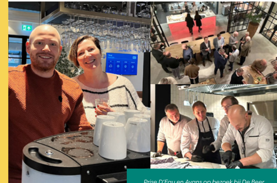
Prise D'Eau en Avans op bezoek bij De Beer

Door de genoemde termijnen in de gaten te houden en (indien nodig) op tijd een voorlopige aanslag aan te vragen of aan te passen, kunt u de verschuldigdheid van belastingrente beperken of geheel voorkomen. Wilt u meer weten over de systematiek van de belastingrente of heeft u vragen over de voorlopige aanslag, neem dan contact op met uw contactpersoon bij De Beer. ■